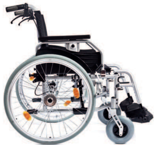
Abb. mit 200 x 50 (mm) Lenkrädern

Der Leichtgewichtrollstuhl Primus ML 2.0 von BescoMed ® füllt eine Lücke im bisherigen Rollstuhlprogramm. Die Anforderungen nach noch wirtschaftlicheren Lösungen bei annähernd gleichen Ausstattungsprofilen der Produkte haben uns veranlasst, dort wo es sinnvoll ist, z.B. auch andere Materialien zu verarbeiten, andererseits aber auch im Komfortbereich gerade die Leistungen anzubieten, die der Leistungserbringer als erforderlich vorgibt. Seitenteile, Armlehnen, Beinstützen, Antriebs- und Lenkräder, Bremsen: alle Details in bekannter BescoMed ® Qualität und bereits bewährt in unserem aktuellen Rollstuhlprogramm. Der Primus ML 2.0 ist ein Rollstuhl, der bereits in seiner Grundausstattung alles bieten kann, was der Rollstuhlfahrer braucht: mit einer Sitzhöhe von 43 -55 (cm) ist er für die meisten Körpergrößen individuell einstellbar. Er ist lieferbar in 7 Sitzbreiten von SB 38 - SB 52(cm). Die Standardsitztiefe beträgt 42 cm, die Rückenlehnenhöhe ist in den meisten Fällen mit 40 cm passend gewählt. Aufgrund der Konstruktion dieses Rollstuhls ist eine Verlängerung des Radstands um 9 cm möglich, und damit ist die Kippsicherheit beispielsweise auch für beinamputierte Menschen gegeben.